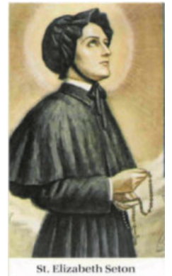
St. Elizabeth Seton