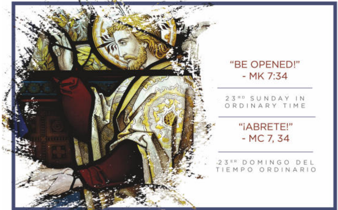
EXCERPTS FROM THE LECTIONARY FOR MASS ©2001, 1998, 1970 CCD. ©LPI

*Bilingual Confession *La confesión bilingüe