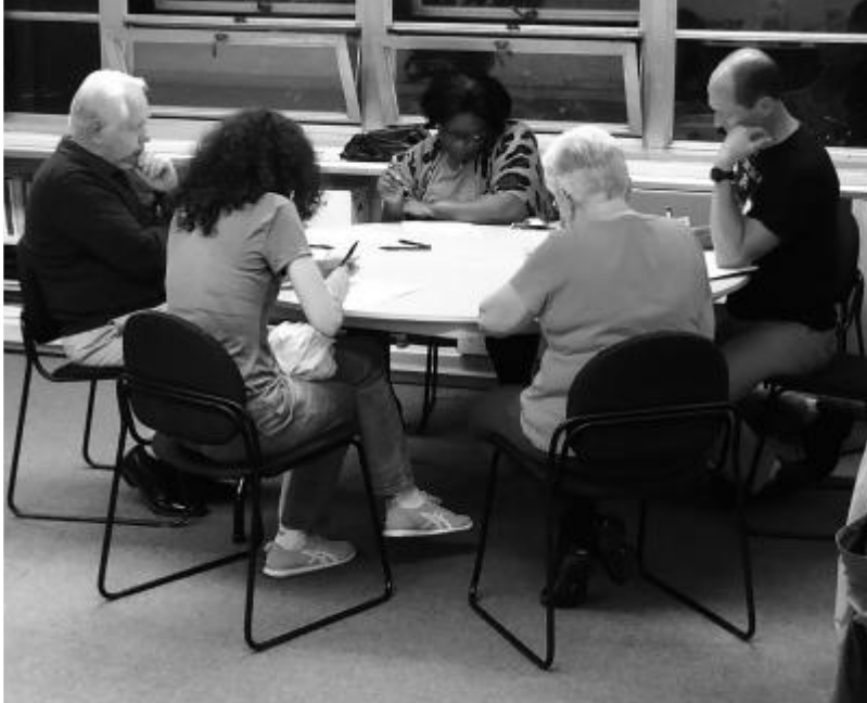
A group of parishioners from Monday night's Synod Small Group meeting.