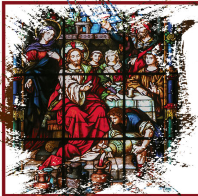
EXCERPTS FROM THE LECTIONARY FOR MASS ©2001, 1998, 1970 CCD. ©LPI

*Bilingual Confession *La confesión bilingüe