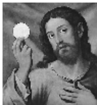
Our Lady of Guadalupe Adoration Chapel

Due to safety concerns, we can no longer allow candles to be put on the floor. Candles must be placed in a holder on the stands. Candles left on the floor will be thrown away. Thank-you in advance for your cooperation! Our Lady of Guadalupe, Pray for us!