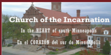
Church of the Incarnation