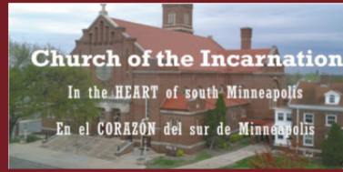
Church of the Incarnation In the HEART of south Minneapolis En el CORAZÓN del sur de Minneapolis

eGiving Electronic Giving Donaciones Electrónicas