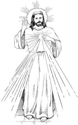
JESUS, I TRUST IN YOU

“The souls that say this chaplet will be embraced by My mercy during their life and especially at the hour of death.” Diary, 754