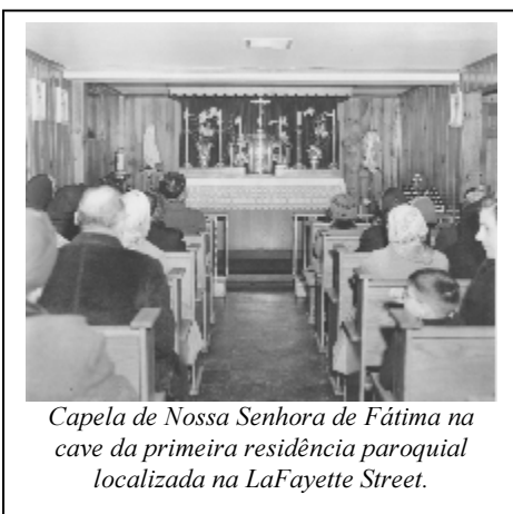
Capela de Nossa Senhora de Fátima na cave da primeira residência paroquial localizada na LaFayette Street.

que todos temos que agradecer: a Deus. Se tudo o que fiz é de Deus, ela há de fazer caminho. Mas, para fazer caminho, ela precisa de todas as vossas mãos. Muito obrigado a todos", terminou.