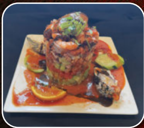
Torre de mariscos