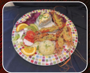
Langostinos al mojo de ajo