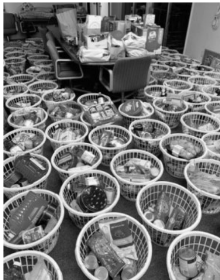
One of the rooms in the Parish Office Building full of Christmas Food Baskets

- See Generosity in Time of Pandemic on the next page -