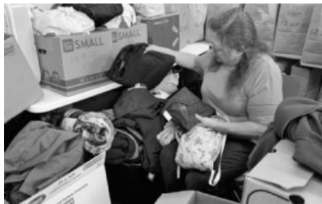
Items to keep the unhoused warm and comfortable Artículos para mantener a los que no tienen vivienda calientitos y cómodos

Al mismo tiempo que la canastas de comida se estaban preparando y distribuyendo en Navidad, el clima se pone frio y incomodo para aquellos que no tienen vivienda. Debido a los fondos adicionales de la ciudad y East Bay Community Energy, pudimos comprar un numero de artículos para hacer la vida un poco mas cómoda en el clima frio, como cobijas, calcetines, y jaquetes. Además, un parroquiano generoso compro paquetitos de artículos de higiene en Amazon, que incluía artículos como jabón, cepillo de dientes, pasta de dientes, champú y artículos para afeitar.