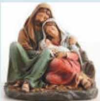
The Holy Family