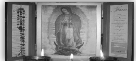
LA VIRGEN PERLUGINA | THE PILGRIMING VIRGIN

En la cafetería de San Gabriel Miércoles de 10am-12pm Para mas información: 313.841.0753