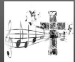
Listen to live praise & worship music by Oremus, part of Awaken ministries.

There is no cost and no registration is necessary.