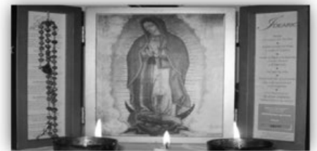
LA VIRGEN PEREGRINA | THE PILGRIMING VIRGIN

En la cafetería de San Gabriel Miércoles de 10am-12pm Para mas información: 313.841.0753